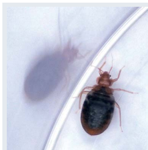
Figure 1. Punaise de lit adulte ( Cimex lectularius ) gorgée.

La punaise de lit est un insecte plat, ovale, de couleur brune, non ailé, qui mesure environ 5 mm au stade adulte (figure 1). De l'ordre des Hemiptera , elle appartient à la famille des Cimicidae (1). Alors que plusieurs espèces de Cimicidae sont impliquées en pathologie vétérinaire ( Cimex columbarius , C. pipistrelli , C. dissimilis , Oeciacus hirundinis ), deux espèces morphologiquement difficiles à distinguer sont plus spécifiquement inféodées à l'homme : C. lectularius , cosmopolite, et C. hemipterus , que l'on trouve en zone tropicale. Les Cimex sont des insectes ovipares à sexes séparés, présentant 5 stades larvaires ; les larves, plus claires et plus petites que les adultes, mesurent entre 1,5 et 4 mm (figure 2). La fécondation est traumatique : le mâle perce l'abdomen de la femelle en différents points. Cette insémination est à l'origine d'une forte mortalité des femelles, due au traumatisme lui-même ou à l'inoculation de