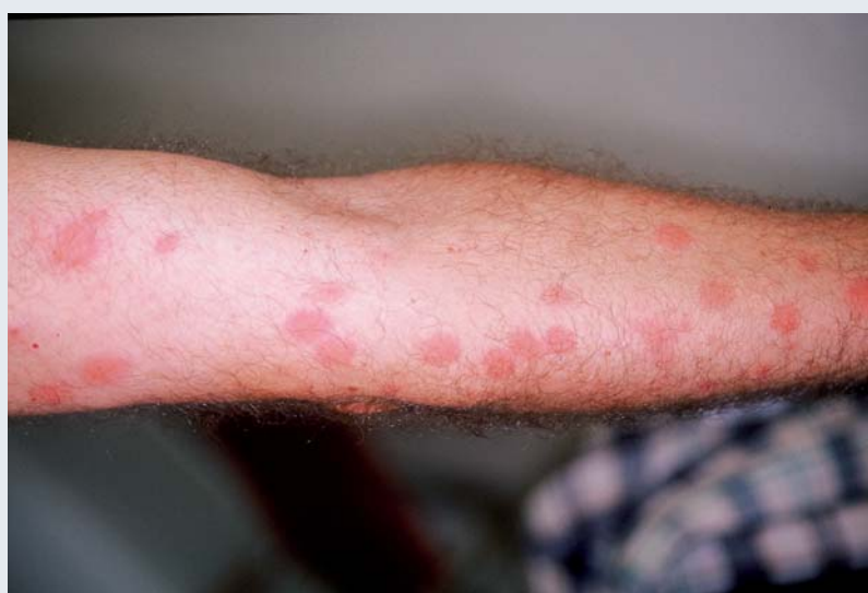
Figure 5. Lésions à type de macules et de papules érythémateuses disposées en ligne.

insectes rampants, à pulvériser sur les points de repos précités, peuvent avoir une efficacité rapide si l'infestation n'est pas trop importante, mais, dans la majorité des cas, le recours à un désinsectiseur professionnel s'avère indispensable.