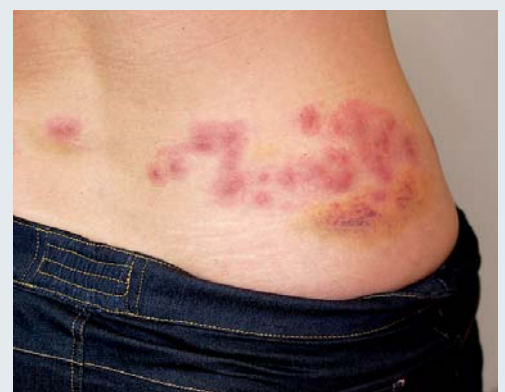
Figure 6. Lésions à type de macules et de papules érythémateuses regroupées.

Outre le désagrément psychologique causé par la découverte de la punaise de lit dans un habitat, la principale conséquence médicale est la nuisance induite par sa piqûre et ses conséquences dermatologiques, allergiques – ou anémiques, dans les cas extrêmes (12). La piqûre, qui a généralement lieu durant la nuit, est indolore du fait de la présence de composés analgésiants dans la salive ; elle n'est donc découverte qu'au matin. Diverses substances composant la salive de l'insecte participent à la réaction cutanée : facteurs anti-X (antihémostatique), oxyde nitrique (activité vasodilatatrice), apyrase (enzyme protéolytique). L'intensité de la réaction induite, très variable, est probablement liée au statut immunologique de l'individu. Si des cas paucisymptomatiques existent (figure 4), la présentation clinique commune est une série de 5 à 15 lésions prurigineuses arrondies à type de macules ou de papules érythémateuses, centrées par un point de piqûre souvent hémorragique ; elles