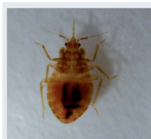
Figure 2. Punaise de lit ( Cimex lectularius ) au stade larvaire (remarquer l'appareil piqueur normalement replié sous la tête).