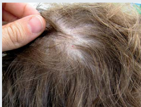
Figure 4. Lésions paucisymptomatiques rarement retrouvées.